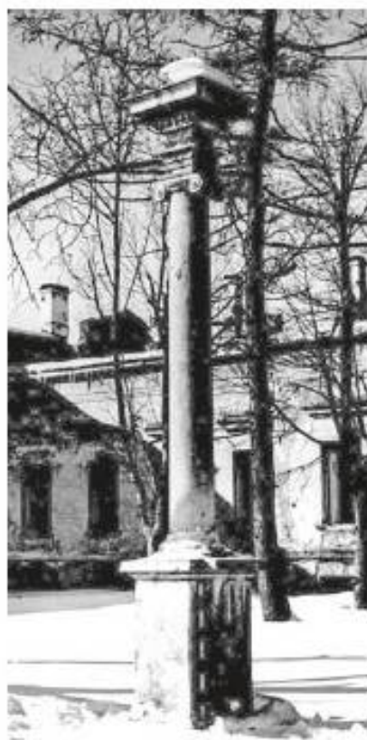
Колонна во дворе дачи К. Е. Сиверса. Фото 1940-х

От бывшей усадьбы Апраксина сад отделяла дорога, которая, обогнув его, продолжалась в южном направлении, образуя главную ось ансамбля. Другая осевая дорога делила надвое приморскую часть.