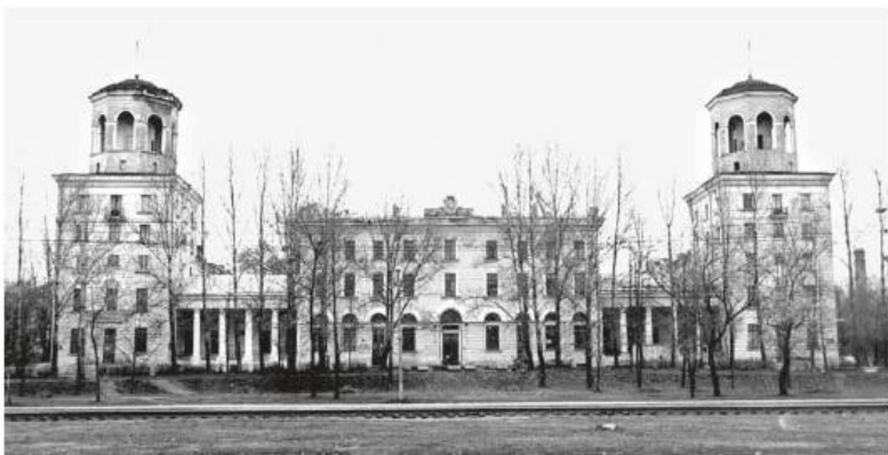
Главный фасад дачи К. Е. Сиверса до и после реконструкции 1950-х гг. Фото нач. XX в. и 1990-х

XIX в. Ансамбль является важнейшей исторической архитектурной доминантой среди застройки 1960–2010-х гг.