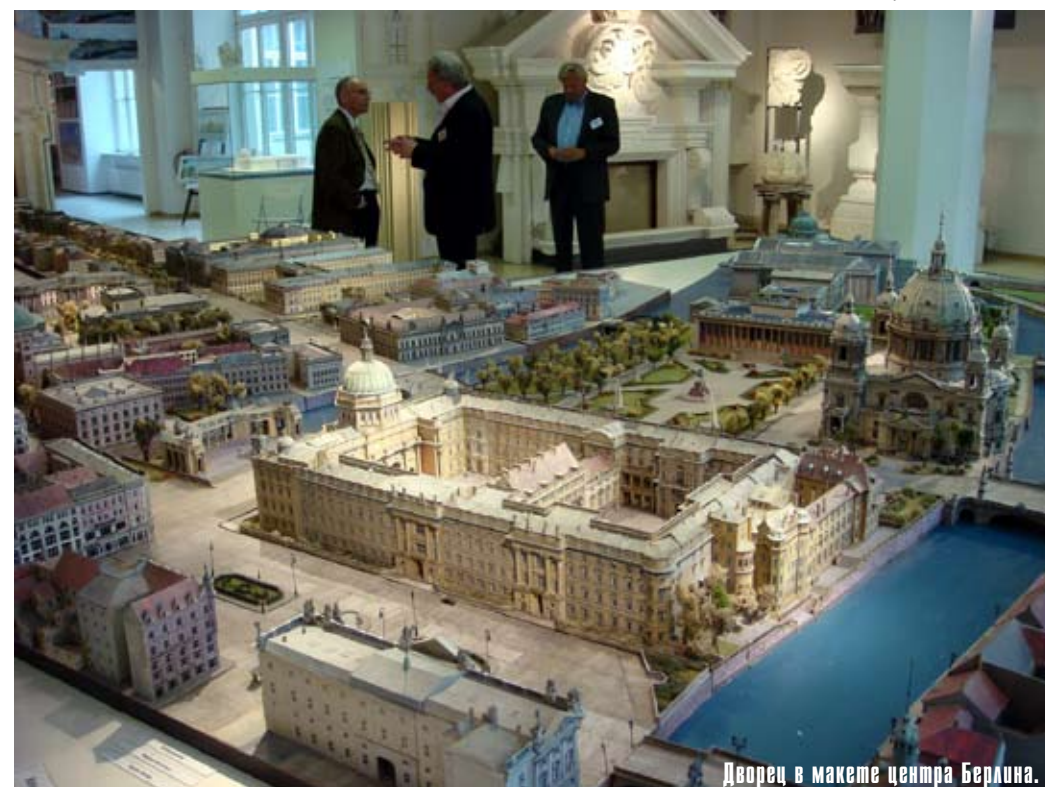
Дворец в макете центра Берлина.

Информационный центр на Хаусфогтайплац. 2008.