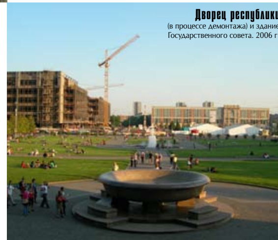
Дворец республики (в процессе демонтажа) и здание Государственного совета. 2006 г.

В конкурсе приняло участие 158 архитектурных фирм и мастерских. Выставка проектов была открыта для всех желающих во