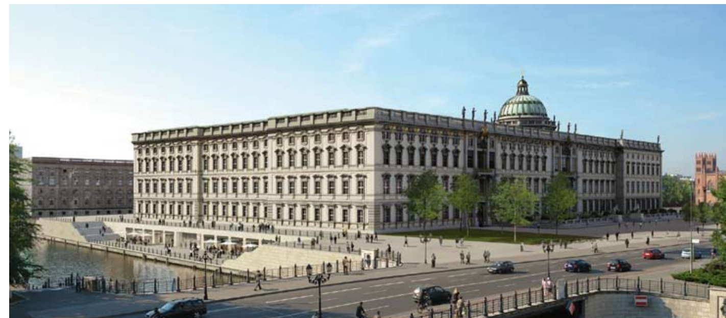
С. Чобан. Перспектива дворца (вид с северо-востока).