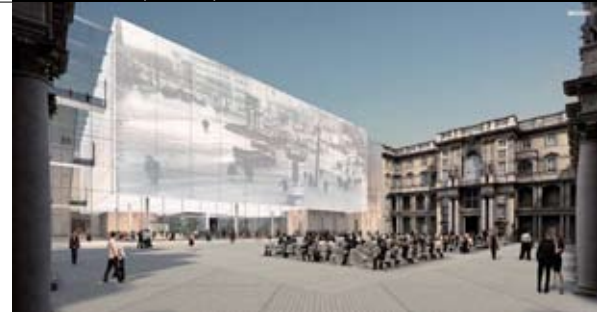
С. Чобан. Атриум в «белом кубе».

Проект получил высокую оценку: фактически он разделил на конкурсе 5-6 места (при