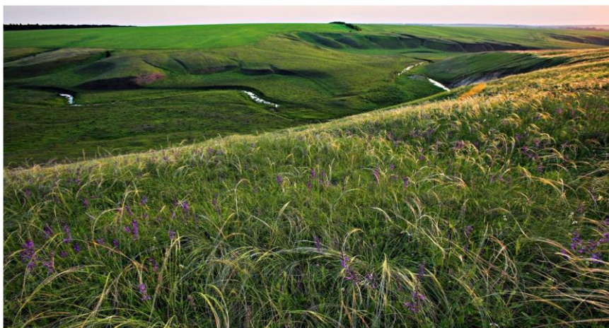
Рис. 3. Куликово поле.

Среди объектов наследия особое внимание обращается на места и объекты, рассказывающие о наиболее ярких событиях, которые там происходили. Все прекрасно знают о военных сражениях, произошедших много лет назад на Бородинском или Куликовом поле. Общественное значение этих мест предопределило отнесение этих мест к объектам культурного наследия (рис. 3). И это несмотря на то, что почти не осталось материальных свидетельств событий, происходивших там много лет назад. Для того, чтобы подтвердить ценность этих мест и сделать их доступными для публики, на основании исторических данных, рассказов современников и литературных источников были воссозданы некоторые из бывших здесь когда-то укреплений, восстановлены исчезнувшие в результате деятельности землепашца или природных процессов траншеи, окопы и редуты. Кроме того, посетитель этих мест на основании путеводителей, рассказов экскурсовода может представить картину поля боя и бывшие там когда-то, но уже давно исчезнувшие военно-инженерные сооружения.