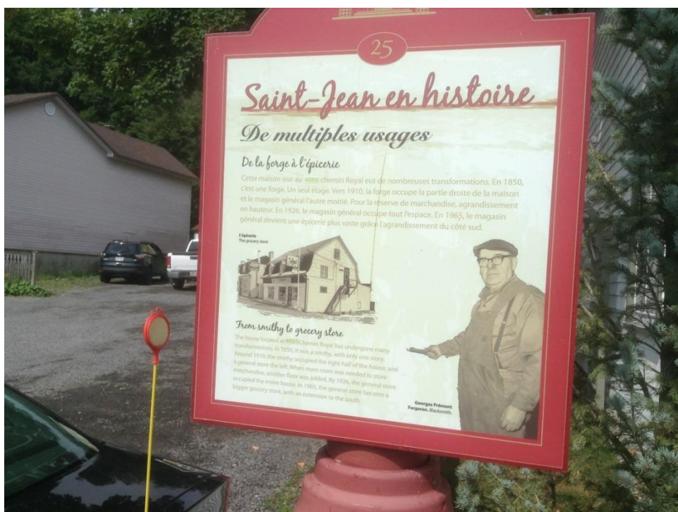
Рис. 4. Информационный щит в деревне Сен-Жан (Канада, Квебек).

Третий принцип, определяющий суть культурно-ландшафтного подхода к наследию, – это связь объекта наследия с окружающей средой. Ценность объекта наследия определяется не только степенью подлинности и сохранности самого объекта, но и его положением в пространстве. Очень важно обеспечить возможность полноценного восприятия памятника как одного из элементов культурного ландшафта (рис. 5). В практике проектирования историко-культурных территорий особую роль играет ландшафтно-визуальный анализ, в результате которого предметом охраны становятся пейзажи, раскрывающиеся с наиболее значимых видовых точек или маршрутов, с которых можно увидеть памятник в его традиционной среде, осознать гармоничность его связей с ландшафтом. Но этого недостаточно. Ценность сооружения как объекта наследия во многом зависит и от характера пейзажей, которые открываются от самого памятника, из окон усадебного дома или церковной колокольни. Все они являются неотъемлемой частью этих сооружений как объектов наследия. Е.В. Николаев в своей книге «По Калужской земле», в главе, посвящённой усадьбе Щепочкина в Полотняном заводе, пишет: «Но главное украшение комнаты – вид из её окон. Природа врывается в дом, и на память приходят слова первого на Руси теоретика садово-паркового искусства А.Т. Болотова о том, что «хороши виды и прекраснейшие положения мест, а особливо лежащие вдали, видимые из окон дома и изображающие бесчисленные красоты природы, всякий дом делают веселейшим» [7].