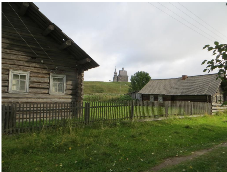
Рис. 6. Село Вершинино в Кенозерском национальном парке.

Иные принципы были заложены в организацию Кенозерского национального парка, где сохранилась часть исторической системы расселения, а многие традиционные для этих мест постройки и предметы остались на своих исконных местах. Это сельские дома с хозяйственными дворами, амбарами и банями, деревянные часовни, кресты, святые рощи, старые дороги, охотничьи и рыбацьи домики (рис. 6). Всё это можно увидеть на территории парка.