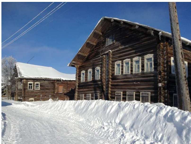
Рис. 2. Деревянные дома в селе Кимжа. Архангельская область.

В связи с нашими размышлениями о взаимодействии человека и природы я хотел бы вспомнить Н.В. Гоголя: «Словом, всё было хорошо, как не выдумать ни природе, ни искусству, но как бывает только тогда, когда они соединяются вместе, когда по... труду человека пройдёт окончательным резцом своим природа, облегчит тяжёлые массы, уничтожит грубо осязательную правильность и нищенские прорехи, сквозь которые проглядывает нескрытый, нагой план, и даст чудную теплоту всему, что создалась в хладе размеренной чистоты и опрятности» [4].