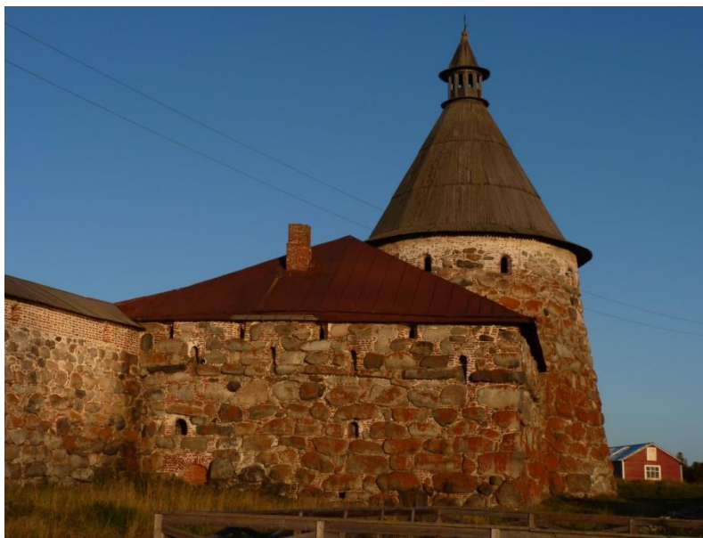
Рис. 1. Соловецкий монастырь. Фото М.Е. Кулешовой

В связи с нашими размышлениями о взаимодействии человека и природы я хотел бы вспомнить Н.В. Гоголя: «Словом, всё было хорошо, как не выдумать ни природе, ни искусству, но как бывает только тогда, когда они соединяются вместе, когда по... труду человека пройдёт окончательным резцом своим природа, облегчит тяжёлые массы, уничтожит грубо осязательную правильность и нищенские прорехи, сквозь которые проглядывает нескрытый, нагой план, и даст чудную теплоту всему, что создалась в хладе размеренной чистоты и опрятности» [4].